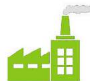
Site Industriel & Collectivité