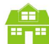
Résidence & Habitation

Clôture ARES - 1 Avenue de Toulouse - Bâtiment F - ZI la Caussade - 31240 L'UNION